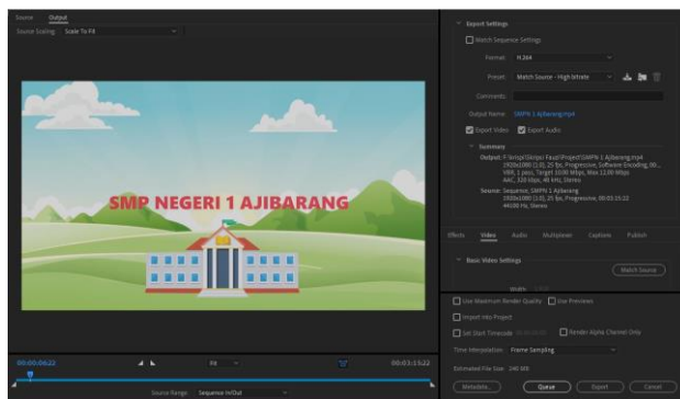
Gambar 5, Proses rendering menggunakan PC/Laptop.

Setelah proses editing selesai, kini masuk ke tahap terakhir yaitu rendering . Disini dilakukan penyesuaian resolusi video, serta pemilihan format untuk video dan audio yang akan di render . Proses render memakan waktu sekitar 15-20 menit sesuai dengan spesifikasi piranti yang digunakan.