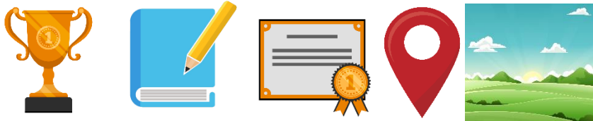
Gambar 2, Bahan icon untuk persiapan animasi.