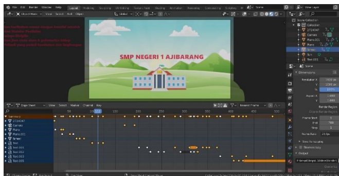
Gambar 3, Proses produksi penggabungan Bahan.

Dalam tahap ini semua assets yang sudah dibuat di tahap pra produksi mulai dimasukkan kedalam software pengolah animasi. Disini penulis menggunakan blender 2.81 sebagai pengolah animasinya. Kemudian assets yang sudah dimasukkan mulai di animasikan sesuai arahan yang ada di dalam naskah yang sudah dibuat di pra produksi tadi. Animasi dilakukan menggunakan teknik squash and stretch yang artinya gerakan animasi harus terlihat lentur. Contohnya seperti pada gerakan icon sekolah yang muncul mulai dari bentuk yang pipih datar kemudian melebar keatas, lalu baru bentuk aslinya terbentuk.